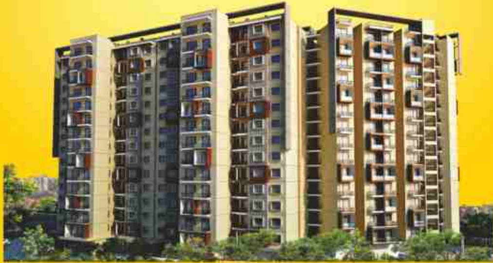
"Pearl Sunrise RC", opp. Japanese Industrial Zone, Jaipur-Delhi Highway, NH-8, Neemrana, Rajasthan

2 Decades of Excellence | 3600 Villas + Plots | More than 500 Apartments | 22 Pearl Tower | 6 Townships